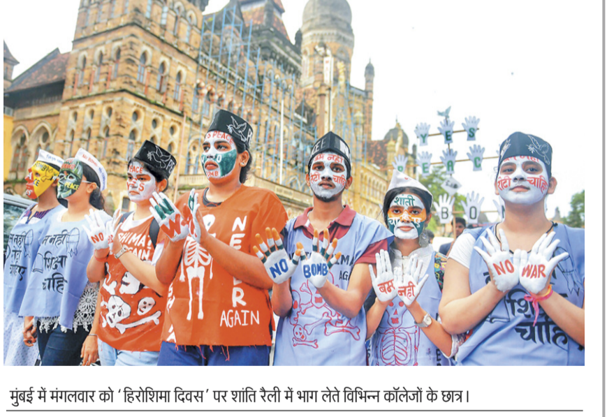
मुंबई में मंगलवार को 'हिरोशिमा दिवस' पर शांति रैली में भाग लेते विभिन्न कॉलेजों के छात्र।